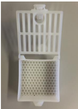
Gabbia per regina con griglia retrattile