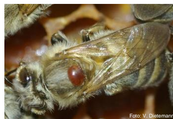
Varroa su un'ape

Fase 2 La covata assomiglia a un «tiro a segno», opercoli aperti, poca covata. Crisalidi, larve o api morte nei telaini o sul predellino di volo. In caso d'incertezza della diagnosi, richiedere l'uscita dell'ispettore degli apicoltori. Le api non possono più essere salvate – eliminarle con lo zolfo.