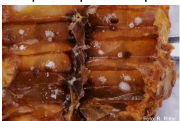
Celle fortemente infestate da varroe

Fase 3 Istinto di pulizia insufficiente, la colonia collassa. Enorme quantità di varroe nelle restanti celle opercolate. Escrementi e poche api sui telaini. Crisalidi morte. In caso d'incertezza della diagnosi, richiedere l'uscita dell'ispettore degli apicoltori. Le api non possono più essere salvate – eliminarle con lo zolfo.