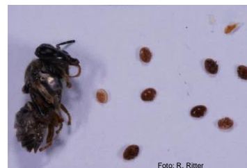
Ape trovata in una cella insieme agli acari