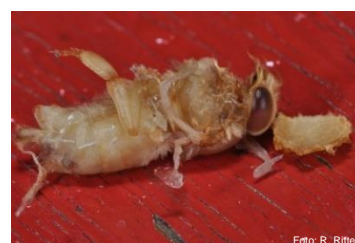
Crisalide morta sul predellino di volo

Fase 3 Istinto di pulizia insufficiente, la colonia collassa. Enorme quantità di varroe nelle restanti celle opercolate. Escrementi e poche api sui telaini. Crisalidi morte. In caso d'incertezza della diagnosi, richiedere l'uscita dell'ispettore degli apicoltori. Le api non possono più essere salvate – eliminarle con lo zolfo.