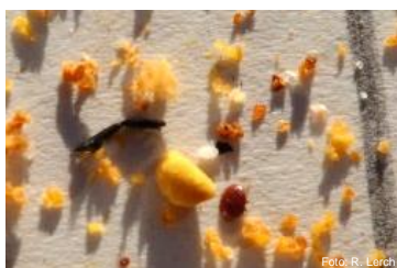
Acari morti su telo

Fase 1 Varroe visibili solo qua e là su alcune api. Cadute di varroe morte: più di 10 acari al giorno. Ultimo momento per salvare la colonia con il trattamento d'urgenza ( prontuari 1.7.1 /1.7.2 ).