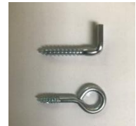
Vite ad angolo e vite ad anello

La larghezza della voliera deve essere adattata alle dimensioni dell'arnia e del predellino di volo. Il fissaggio semplice consente di staccarla e riattaccarla facilmente per la rimozione delle api morte.