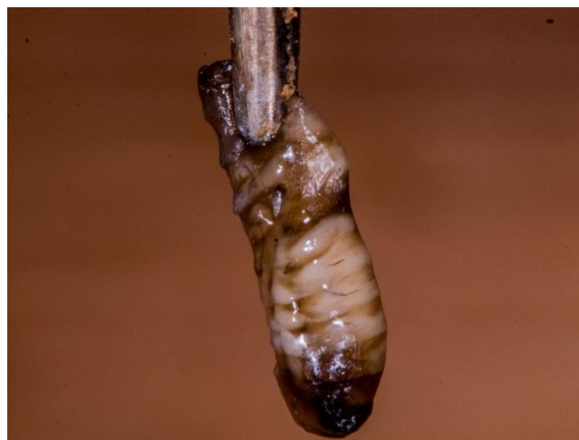
Pre-ninfa morta con accumulo di liquido

(rosso: celle completamente disopercolate pronte a essere svuotate – due frecce in alto a sinistra: rischio di confusione con la peste europea; blu: opercoli lacerati che iniziano a disopercolarsi)